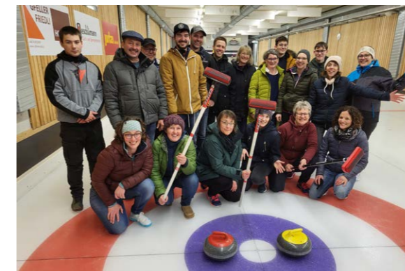
Gruppenfoto Helferinnen und Helfer