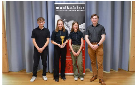
Siegreiches Quartett EMIF