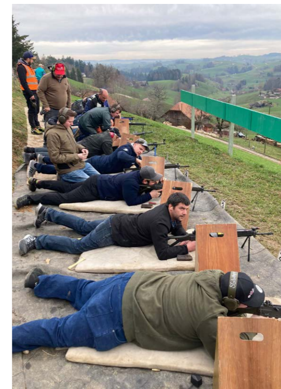
Warten aufs Zeigen