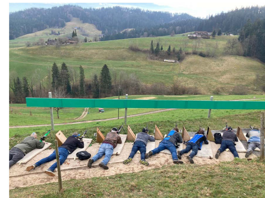
Schiessplatz mit Scheibenstand