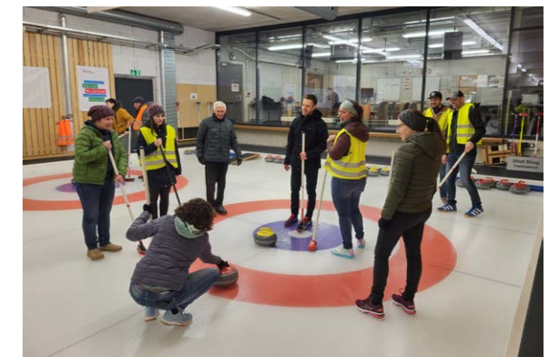
Analyse des Matches