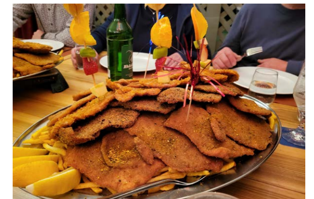
Nachtessen im Schnitzel House