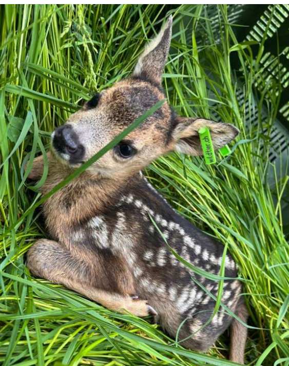
Das Rehkitz wird nach dem Auffinden mit einer Kiste zugedeckt, bis das Mähen abgeschlossen ist.

Die drei Luthertaler Reviere danken den Landwirten für ihre Rücksichtnahme und Durchführung der Massnahmen zum Wohle der Wildtiere und ihrer Jungen.