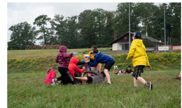
Spiel und Spass im Sommerlager 2023

Hoffentlich bis Bald. Leiter*innen der Jubla Grossdietwil