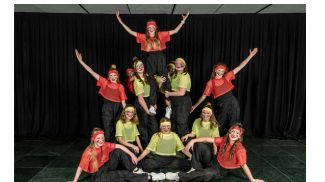
Gruppenfoto der Spice Chicas

Auch wenn die Mädchen keinen Glaspokal mit nach Hause nehmen konnten, kamen alle zufrieden und mit einem Rucksack, voll mit schönen Erinnerungen, wieder in Hüswil an.