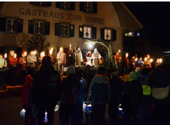
Besammlung auf dem Sonnenplatz