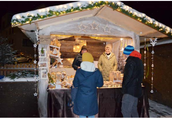
Häuschen mit Feinem aus der Backstube