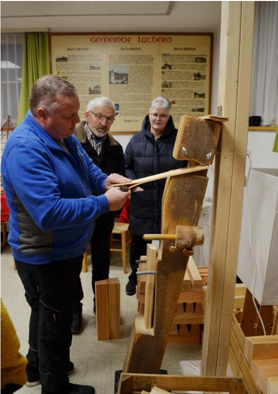
Schindelmachen ist Handarbeit