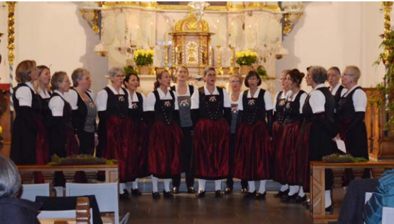
Adventssingen mit den Jodufroue Willisau

Der stimmungsvolle Luthertaler Wiehnachtsmärt auf dem Dorfplatz in Luthern war auch in diesem Jahr ein grosser Erfolg und lockte wie auch in früheren Jahren viele Besucherinnen und Besucher ins tief verschneite Luthertal, die sich nicht nur vom liebevoll gestalteten Markt, sondern auch vom interessanten Rahmenprogramm begeistern liessen. Schon zu Beginn am Freitagabend fand in der bis auf den letzten Platz gefüllten Pfarrkirche mit dem besinnlichen Adventskonzert der Jodufroue Willisau ein erster Höhepunkt statt, wo sie mit ihren Liedern und Geschichten das Publikum zum kommenden Advent einstimmten.