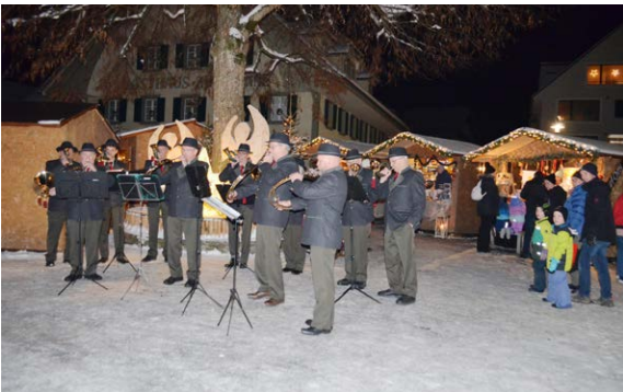
Ständchen mit den Jagdhornbläsern Luzerner Hinterland