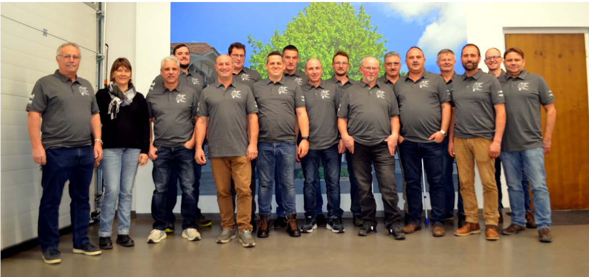
Die neu eingekleidete Männerriege zusammen mit den Sponsoren