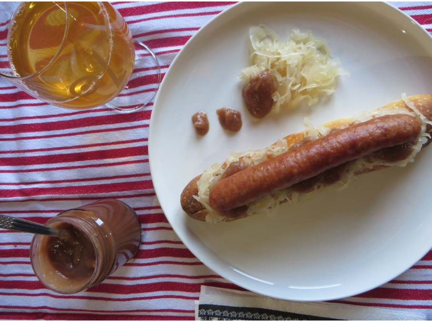
Knuspriger Sauerkraut-Hotdog mit Apfel-Chutney