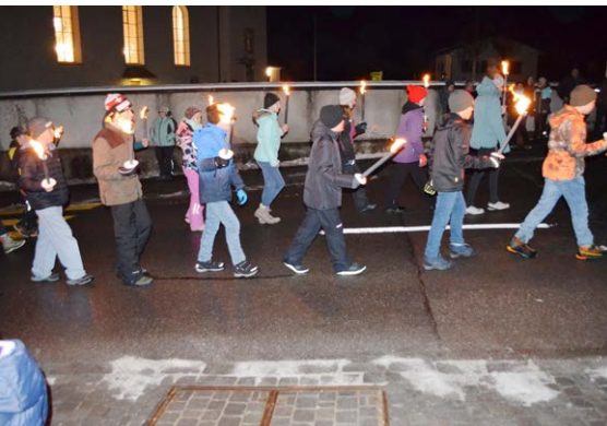
Fackelträger erhellen die Dunkelheit