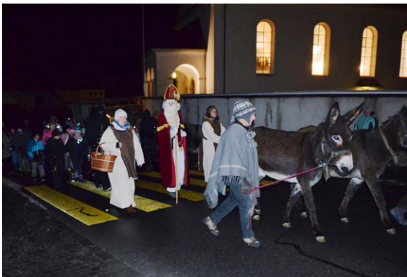
Der Samichlaus zieht ein