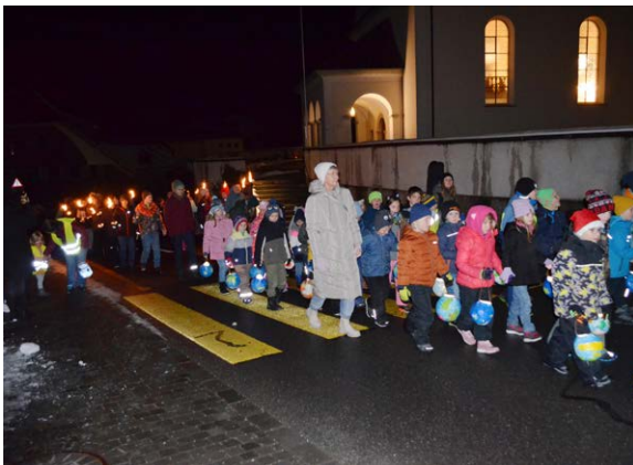
Kinder begleiten den Samichlaus