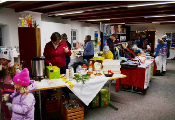
Koffermarkt im Pfarrspycher