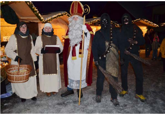
Samichlaus mit Gefolge ist unterwegs