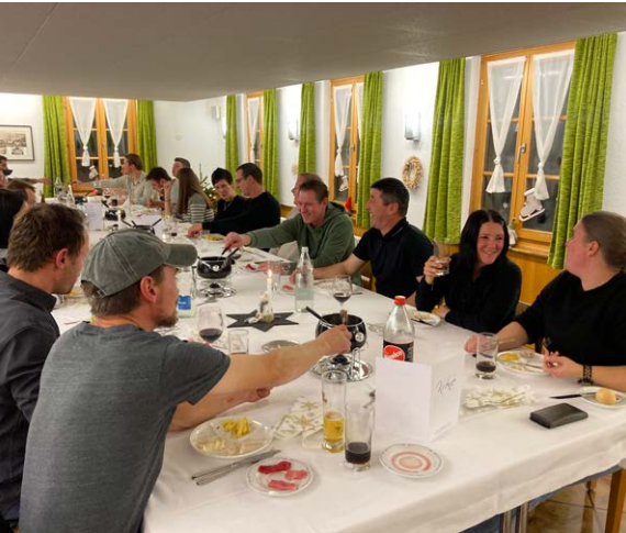
Die Christen AG geniesst das feine Fondue Chinoise im Gasthaus Krone

Am 5. Dezember feierte die Christen AG das jährliches Weihnachtsessen im Gasthof Krone in Luthern. Nach dem Apéro im Kronenkeller gab es ein feines Fondue Chinoise, gemütliche Gespräche und viel zu lachen – kurzum, ein Abend zum Geniessen! Ein herzliches Dankeschön an das Krone-Team für die tolle Gastfreundschaft.