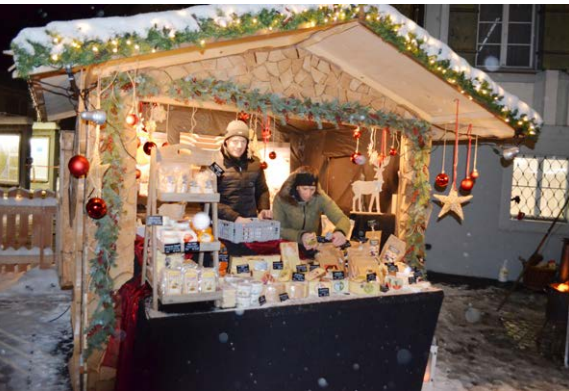
Feine Spezialitäten aus der Napfchäsi