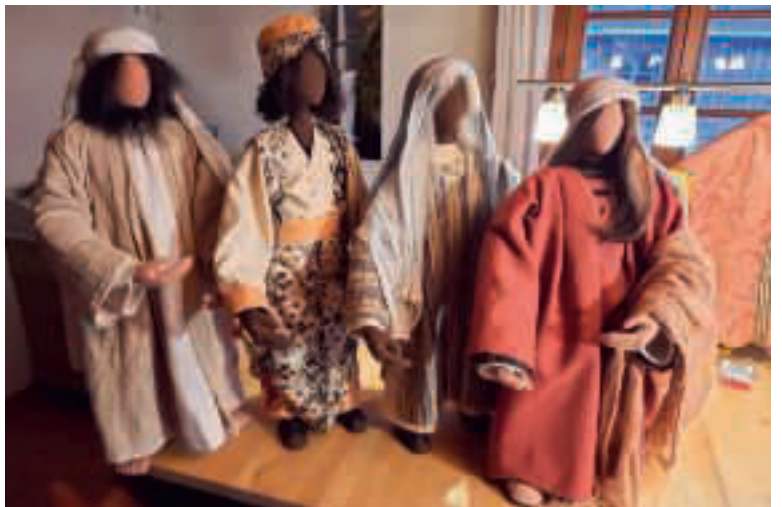
Die biblischen Figuren erstrahlen nun wieder in neuem Glanz.