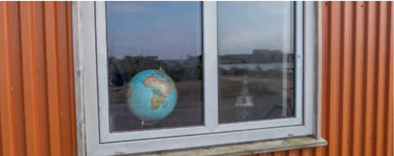
Blick in ein Fenster am Hafen von Thorsminde, Jütland

D er Stern am Firmament deines Herzens ist ein Bild für die Sehnsucht, die dich treibt. Trau deiner Sehnsucht, folge ihr bis an den äussersten Rand.