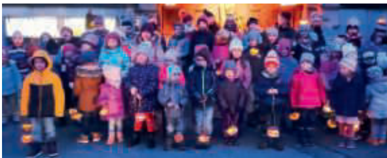
Die frohe Kinderschar beim Räbeliechtliumzug.

Der Gottesdienst und das anschliessende Zmorge findet coronakonform beim gedeckten Teil des Schulhausplatzes statt. Wir bitten um witterungsangepasste Kleidung. Jede/r bringt bitte ein Holzschneit/Knebel mit.